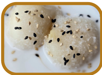
Perles coco 7,50 €