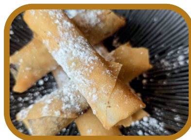
Nems au Nutella ou au taro thaï 6,50 €