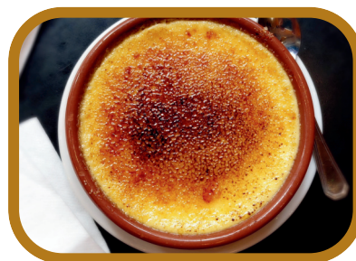
Crème brûlée 5,50 €