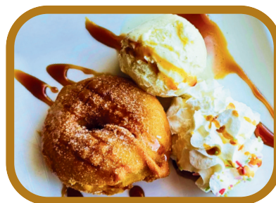
Beignet maison, boule de glace et chantilly 7,50 €