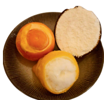
Fruit givré sorbet orange, citron ou coco 6 €

parfums au choix : vanille, chocolat, fraise, rhum raisins, pistache, sorbet framboise, sorbet mangue, sorbet passion