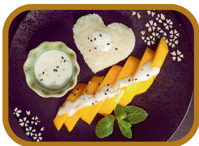
Riz gluant à la mangue 10,50 €