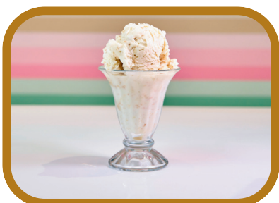
Coupe de glace 1, 2 ou 3 boules 3 € / 5,50 € / 7,90 €