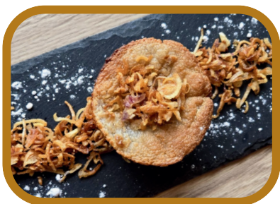
Flan thaï (patate douce, coco, échalotes frites) 5,50 €