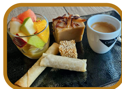
Café ou thé gourmand 10,50 €

parfums au choix : vanille, chocolat, fraise, rhum raisins, pistache, sorbet framboise, sorbet mangue, sorbet passion